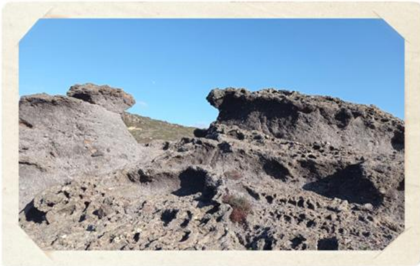
figure antropomorfe e "porta per altri mondi"