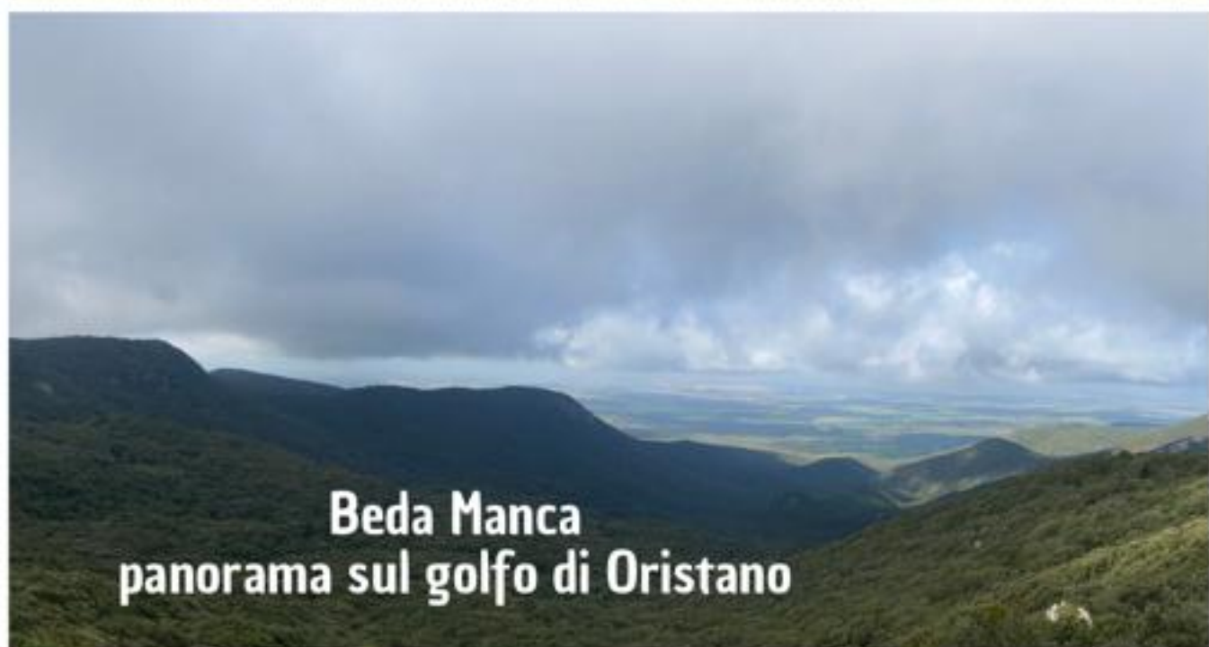
Beda Manca panorama sul golfo di Oristano