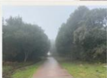
prima parte del percorso