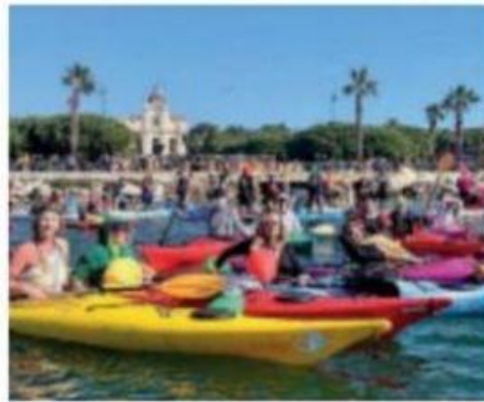
Un'escursione in kayak

L'escursione sarà divisa in due parti: la prima sarà un percorso marino utilizzando i kayak, la seconda sarà dedicata all'esplorazione terrestre. Sono già arrivate 95 adesioni: di queste persone, 48 effettueranno anche la pri-